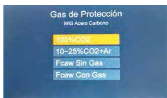
FCAW Sinérgico con y sin gas de protección