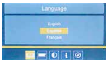
Configuración de idioma