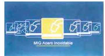
GMAW Sinérgico acero inoxidable