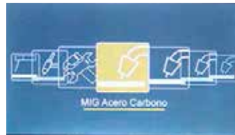
GMAW Sinérgico acero al carbono